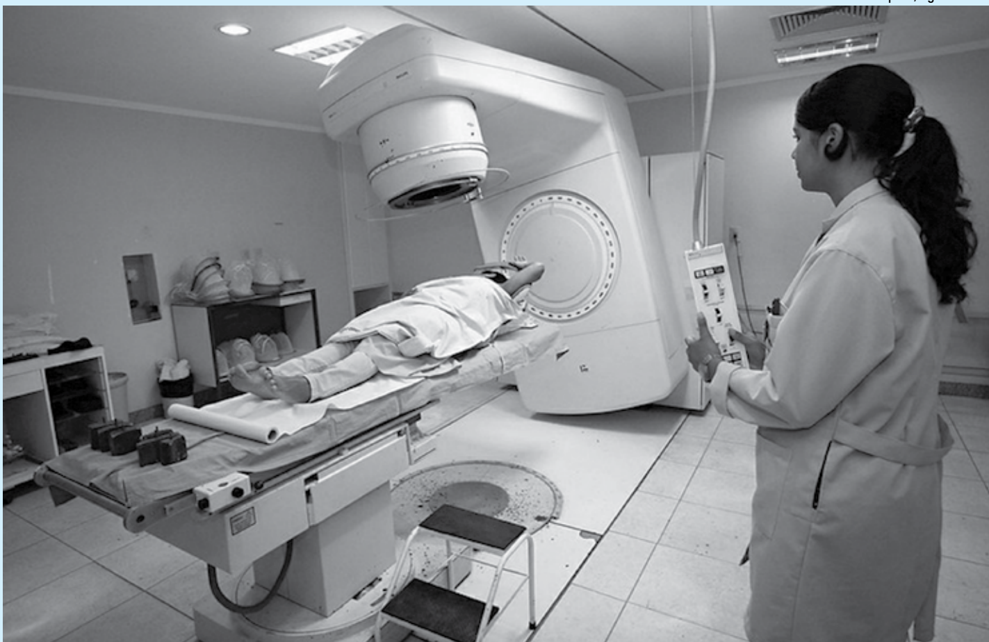
Equipamentos de radioterapia serão produzidos no Brasil a partir de fevereiro do ano que vem, segundo o Ministério da Saúde

O aparelho entregue em Brasília tem capacidade para realizar 43 mil sessões de radioterapia por ano, ampliando o atendimento em até 25%.