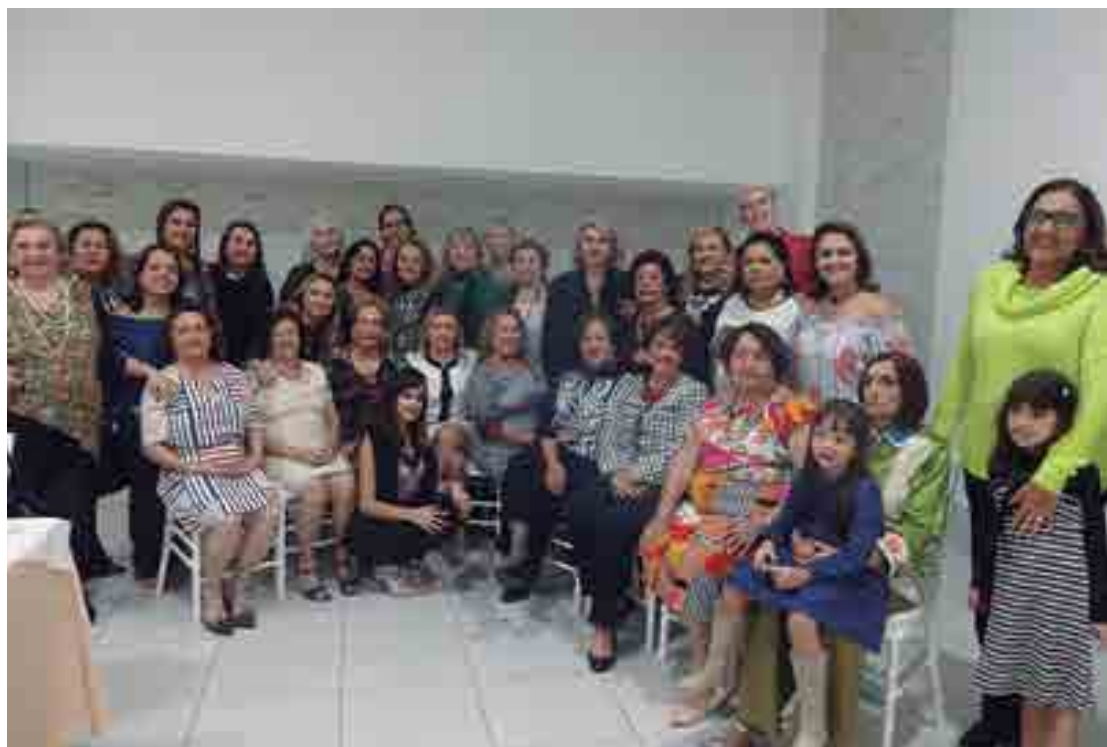
A gloriosa turma de amigas no encontro solidário no Sonho Doce