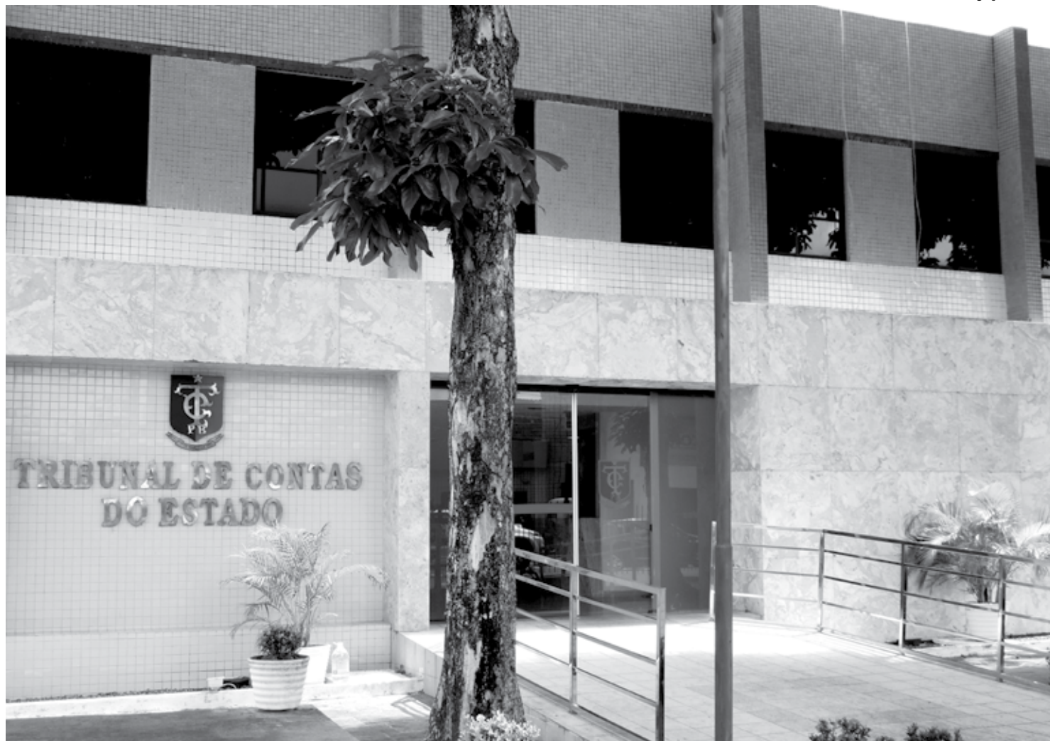
Dezenas de processos referentes a atos de concessão de registros de aposentadorias e pensões de servidores públicos ou seus dependentes também foram apreciados