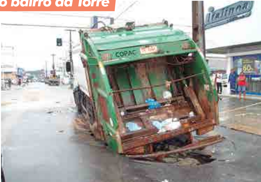
Veículo coletor de lixo ficou preso em buraco provocado por rompimento de tubulação devido às chuvas