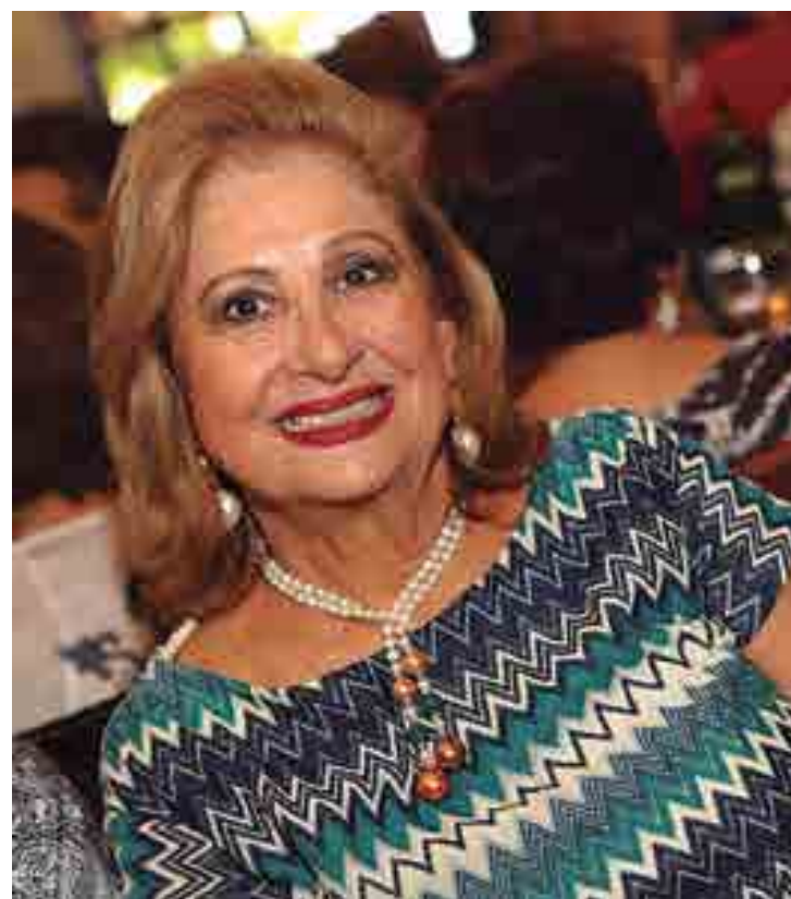
Procuradora federal Lúcia Bezerra é a aniversariante de hoje