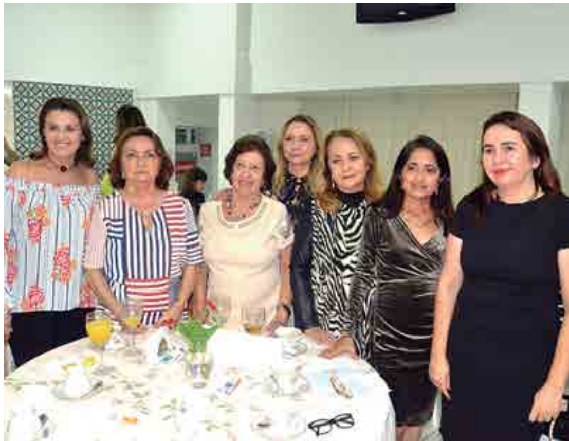
Mais imagens do bonito encontro no Sonho Doce na última quarta-feira