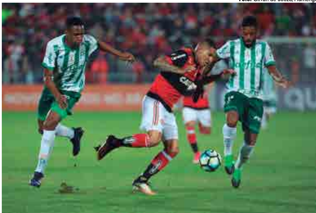
Na última quarta-feira, o Palmeiras conseguiu empatar com o Flamengo em 2 a 2 na Ilha do Urubu

O zagueiro ficou em São Paulo (SP), poupado, e o reforço para o ataque tinha de aprimorar a parte física - ele já está regularizado. Cuca ainda não disse se os dois serão titulares, mas o centroavante tem mais chances de começar a partida contra o Sport, já que Borja está suspenso, e Willian sentiu a coxa. O camisa 29, inclusive, deve voltar a São Paulo para