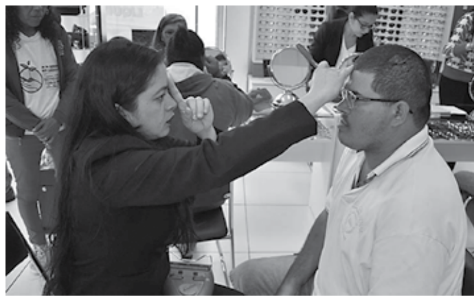
Trabalho é acompanhado por profissionais da Universidade Estadual

Recém-inaugurado, o prédio onde as aulas aconte-