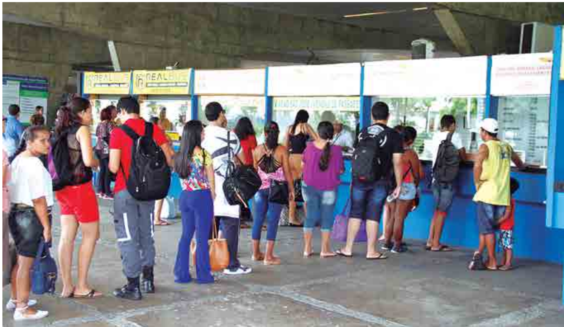
Para coibir a venda casada durante a compra de passagens, o respectivo seguro só poderá ser cobrado se o passageiro depois de informado devidamente fizer a opção pelo pagamento

cimento determinar; Restrição do acesso em horários de maior atividade; O número máximo de clientes admitidos, simultaneamente, devendo sempre estar acompanhado por um funcionário do estabelecimento, sendo vedada a manipulação de objetos e alimentos; Que o cliente utilize os mesmos parâmetros e precauções higiênicas e de segurança obrigatórias aos profissionais que trabalhem nos recintos onde são