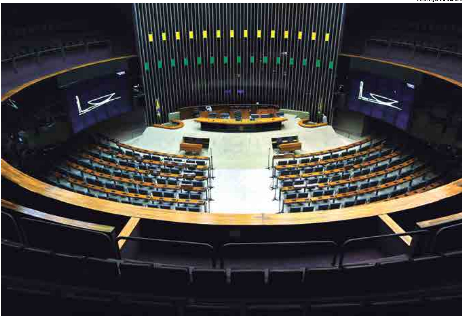
A votação só será aberta com a presença em plenário de 342 deputados. Esse é o número mínimo de votos para aprovar ou rejeitar o parecer, segundo a Constituição Federal

A votação só será aberta com a presença em ple-