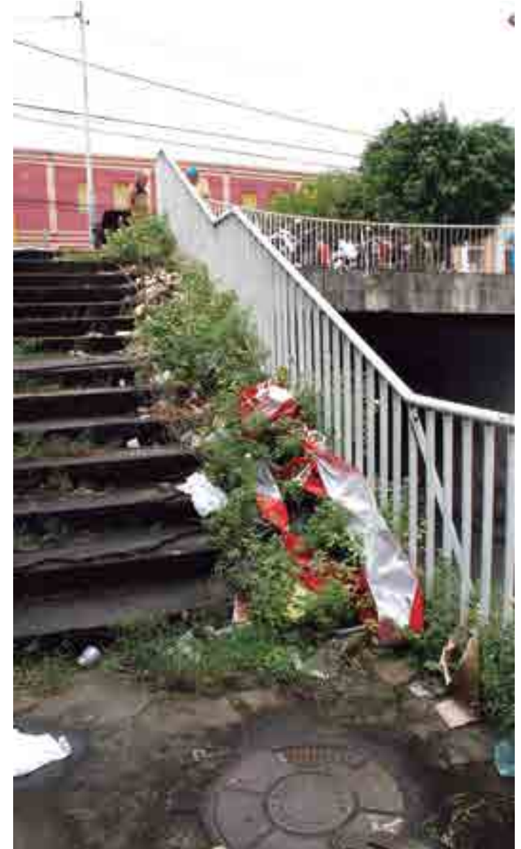
Lixo e mato demonstram o estado de abandono do Viaduto Terceirão

Já o Viaduto Dorgival Terceiro Neto (Terceirão), construído no centro da capital para ligar a cidade alta com a cidade baixa, foi inaugurado no ano de 1979. Terceirão é um apelido em homenagem ao ex-prefeito Dorgival Terceiro Neto, pois foi na sua gestão que a obra foi construída. Ele se inicia na Rua Miguel Couto e desemboca na Rua Cardoso Vieira.