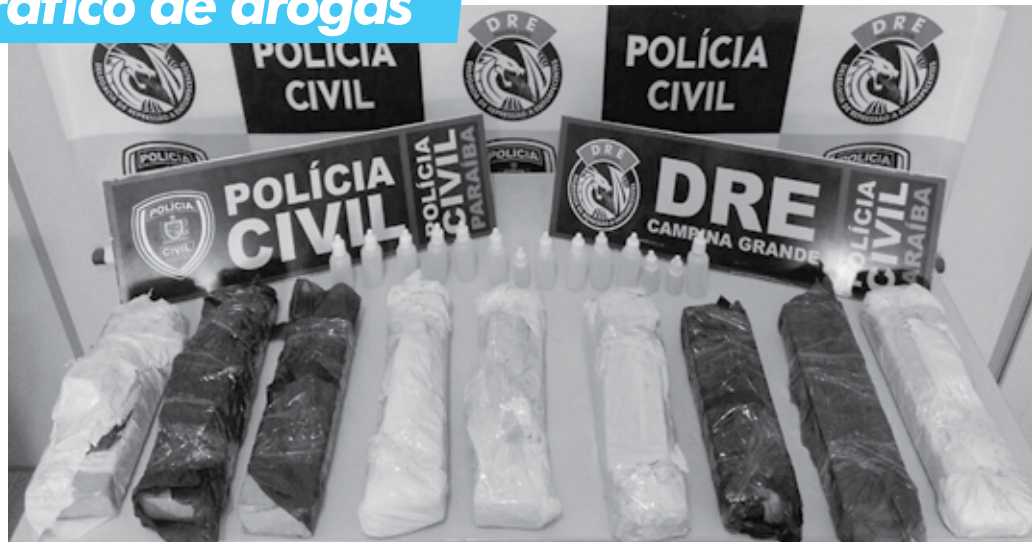
Maconha prensada e frascos de entorpecente foram localizados após denúncia pelo número 197