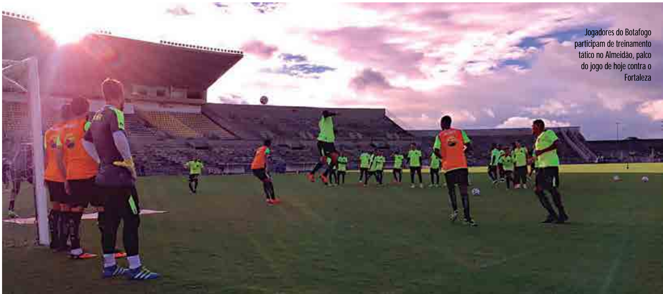
Jogadores do Botafogo participam de treinamento tático no Almeidão, palco do jogo de hoje contra o Fortaleza